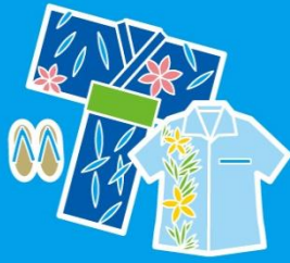
夏らしく 涼しげな服を