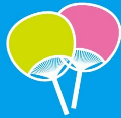
少しの風で 体感温度がちがいます