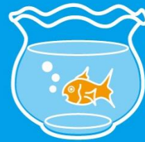
涼しげなものを お部屋にひとつ