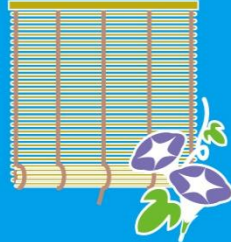
直射日光をさえぎる 伝統の知恵