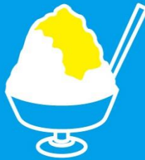
目にも涼しく 体にひんやり